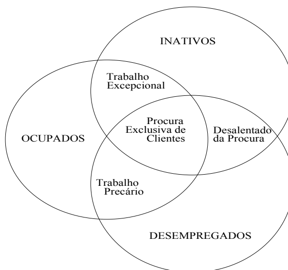
FIGURA 1 Fronteiras na condição de atividade em mercados de trabalho heterogêneos

Essa realidade requer instrumental adequado para compreensão de suas características, principalmente no que diz respeito às formas alternativas de inserção produtiva e subutilização da força de trabalho.